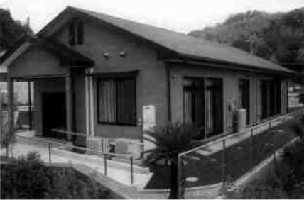
▲平田一丁目集会所の全景、後方には駐車場も完備している。

平田一丁目集会所が完成し、四月一日より供用を開始しました。木造平屋建、二二二平方メートルで、集会所(洋室)、和室、厨房、男女トイレを備えた近代的な建物で、駐車場もあり、使い勝手の良い印象を受けます。入野、白井谷、すみれヶ丘の三自治会が相互使用になっています。これまで、平田供用会館で各種集会所を開催していましたが、近くにできたことにより、更に、活発な自治会活動が予想されます。三自治会にとっては長年の夢であったことから、広範な有効利用を図っていただきたいと思えます。