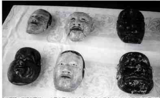
江戸期の著名能面打ち、出目右満(でめうまん)作と伝えられる神楽面、十三面ある

神社は平田三丁目に鎮座している。創建年代は不詳であるが、現在地に遷祀したのが元和年間(一六一五)と伝えられる。社宝として出目右満(でめうまん)作の神楽面がある。美術工芸品の多くは誰が作ったかで価値が決まる。そこで、出目右満なる人物について探ってみた。出目家は能面打ち(能面を作る)の宗家として、室町時代の後期、越前出目家(福井県武生市)と大野出目家(福井県大野市)が誕生する。その後、近江井筒家(滋賀県長浜市)が誕生する。江戸時代には彼らを祖とする三系統が家業として代々能面打ちを世襲し、増大する能面需要に応えることになった。この出目家の流れをくむ右満は、元禄年