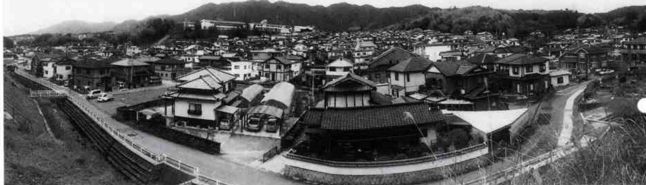
▼家々が建ち並び、道路や河川の整備が進んでいる現在の風景

平田村は 東西十九丁、 (約二km) 南北十二丁。 岩国より一里。 (約四km) 小瀬より三里。 上関より十三里。 当村は、 早苗どころなり。 (玖珂郡誌より)